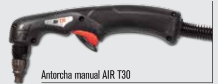
Antorcha manual AIR T30