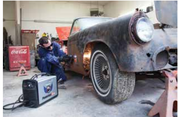
Reparación y modificación de vehículos