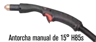
Antorcha manual de 15° H85s