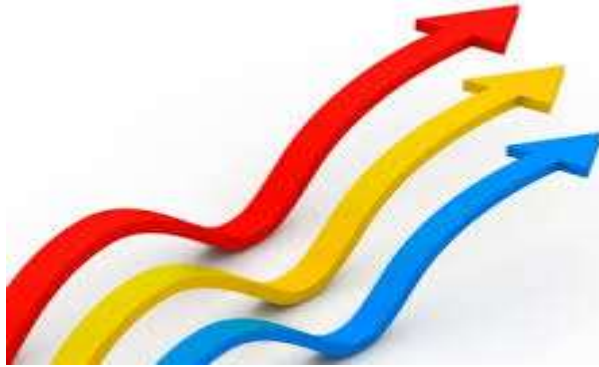
Evolución de Activos, Cartera y Puntos de Atención